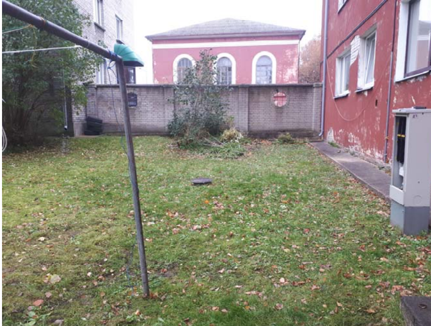
Pilt 1. Jaotuskilp Pepleri tn 3, ristumine seinaga