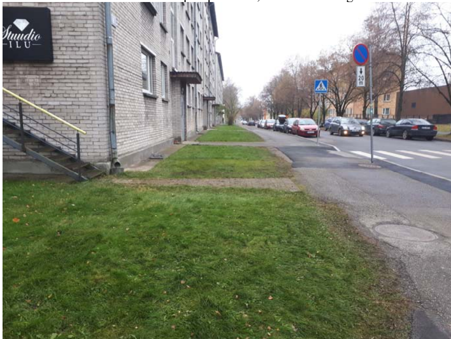
Pilt 2. Kulgemine Tiigi tn 8 hoone ees