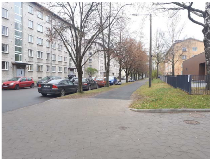
Pilt 3. Ristumine Tiigi tänavaga