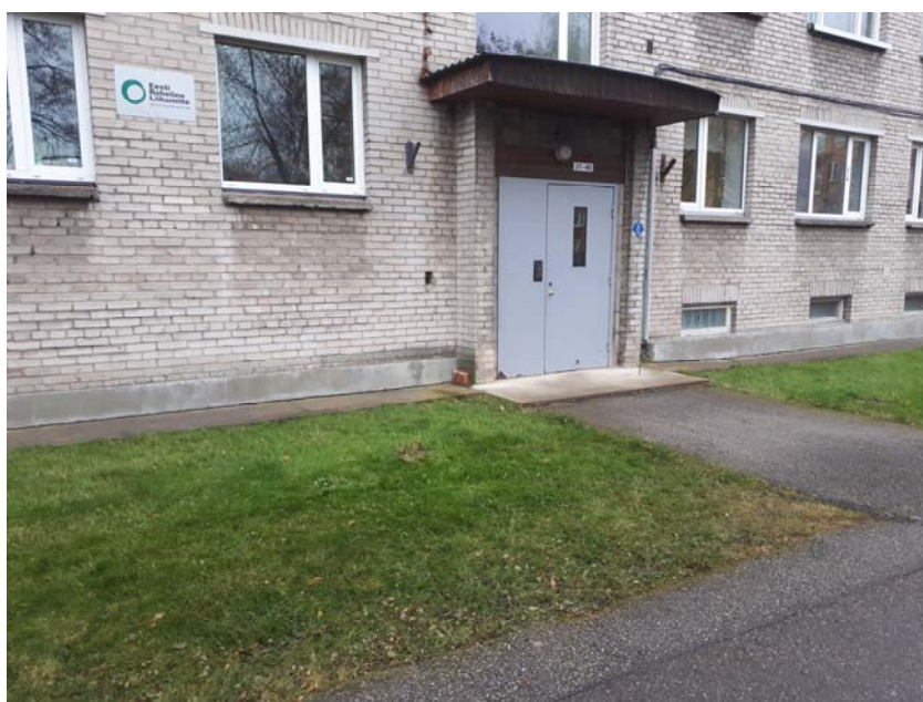
Pilt 4. Uue LK ja JK asukoht