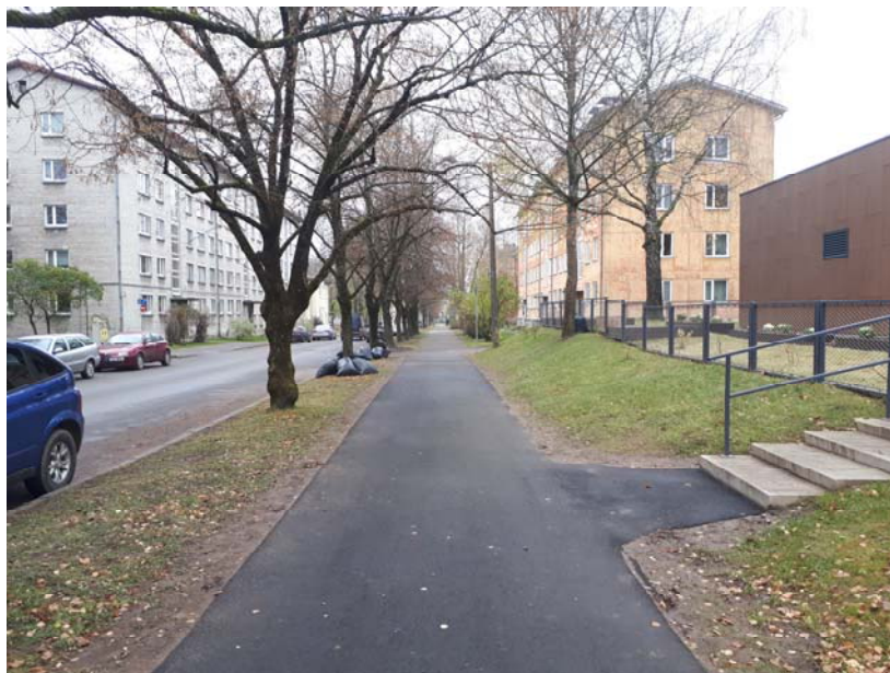
Pilt 5. Kulgemine kõnniteel kinniselt