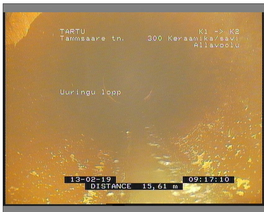
Pilt: K1_K2_1_091724_2_A.JPG, 00:01:36 15,61m, Uuringu lõpp