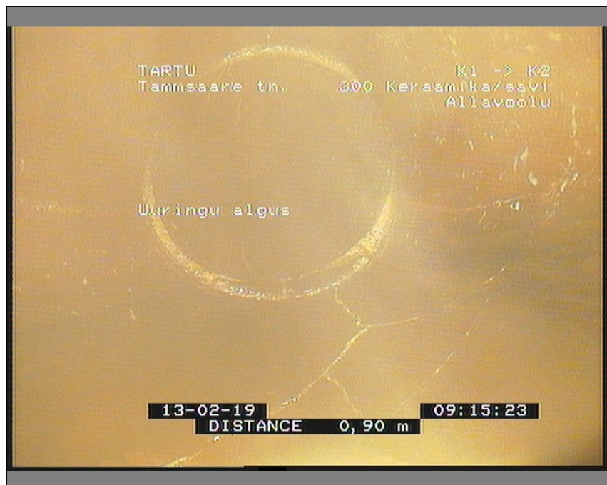
Pilt: K1_K2_1_091537_1_A.JPG, 00:00:00 0,9m, Uuringu algus