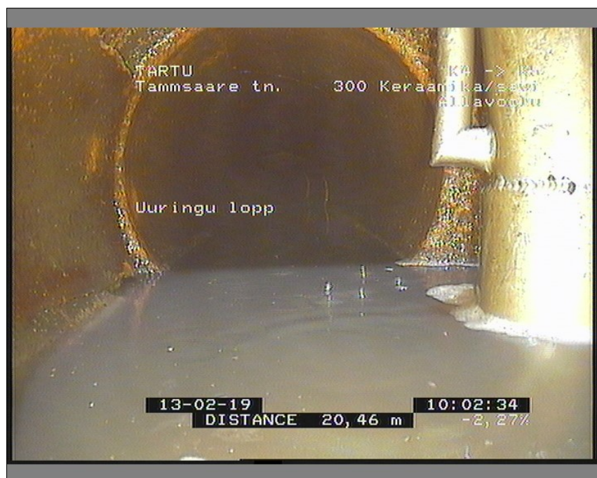
Pilt: K4_K5_4_100248_2_A.JPG, 00:00:52 20,46m, Uuringu lõpp