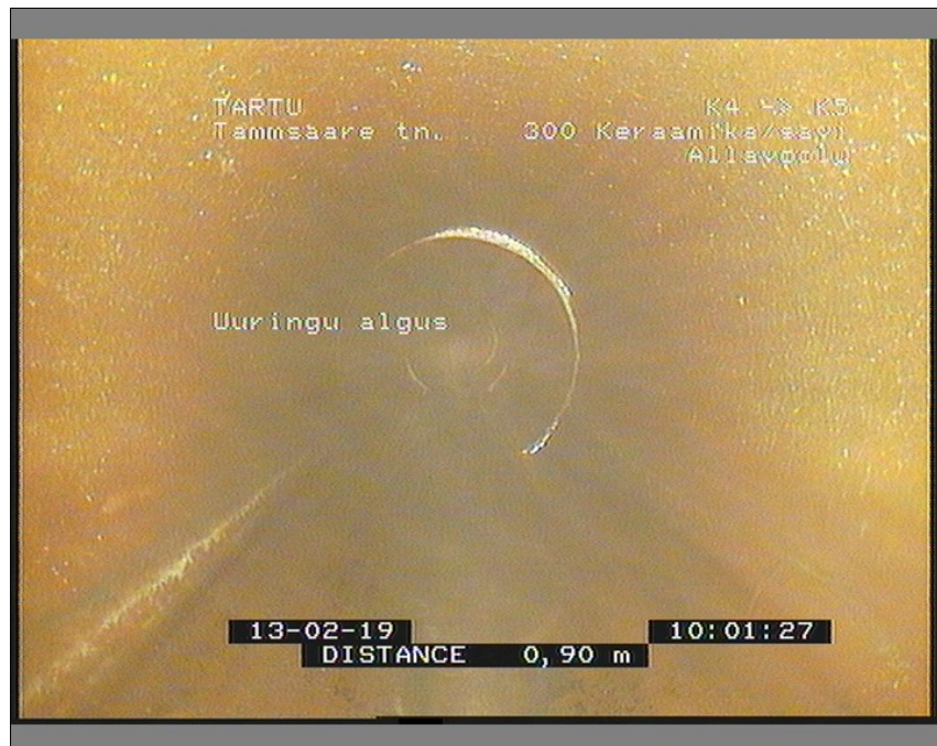
Pilt: K4_K5_4_100142_1_A.JPG, 00:00:00 0,9m, Uuringu algus