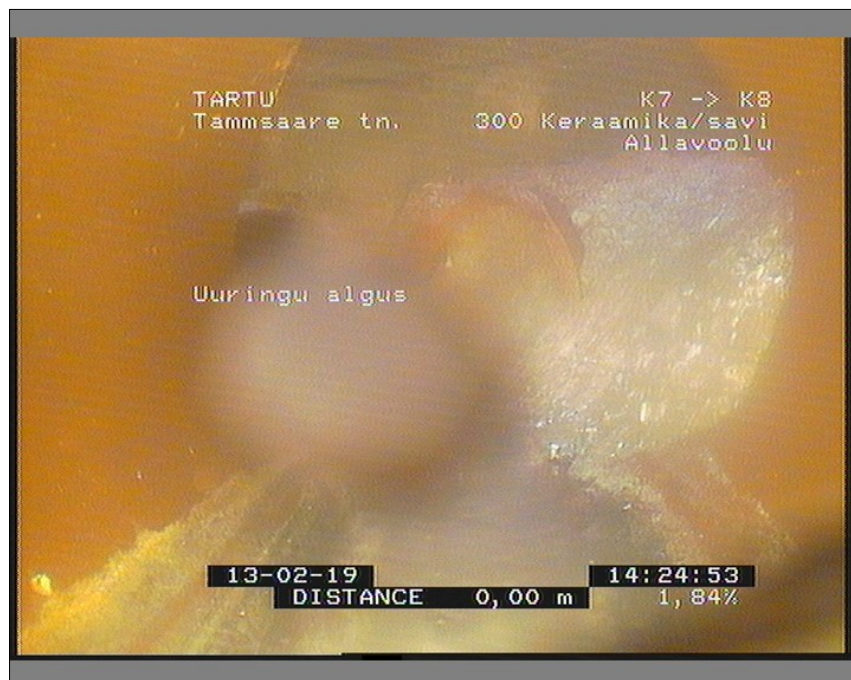
Pilt: K7_K8_7_142508_1_A.JPG, 00:00:00 0m, Uuringu algus