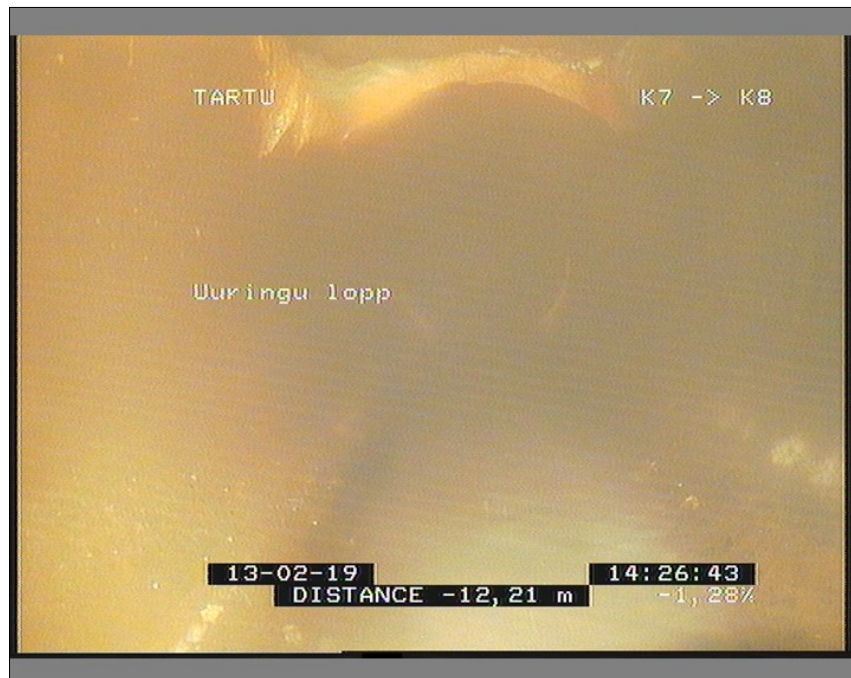
Pilt: K7_K8_7_142658_1_A.JPG, 00:01:17 -12,21m, Uuringu lõpp