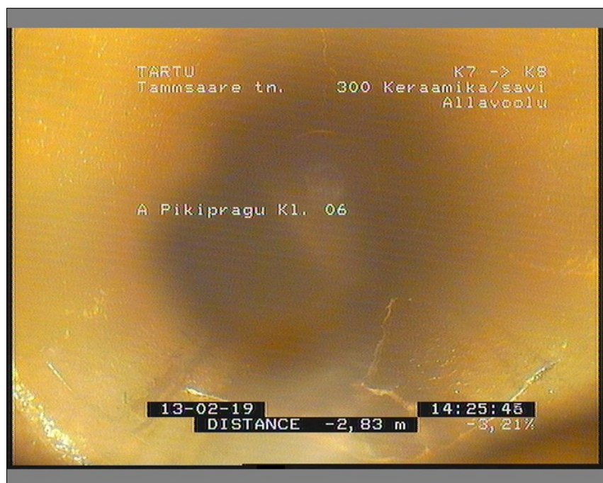
Pilt: K7_K8_7_142600_1_A.JPG, 00:00:30 -2,83m, A Pikipragu Kl. 06