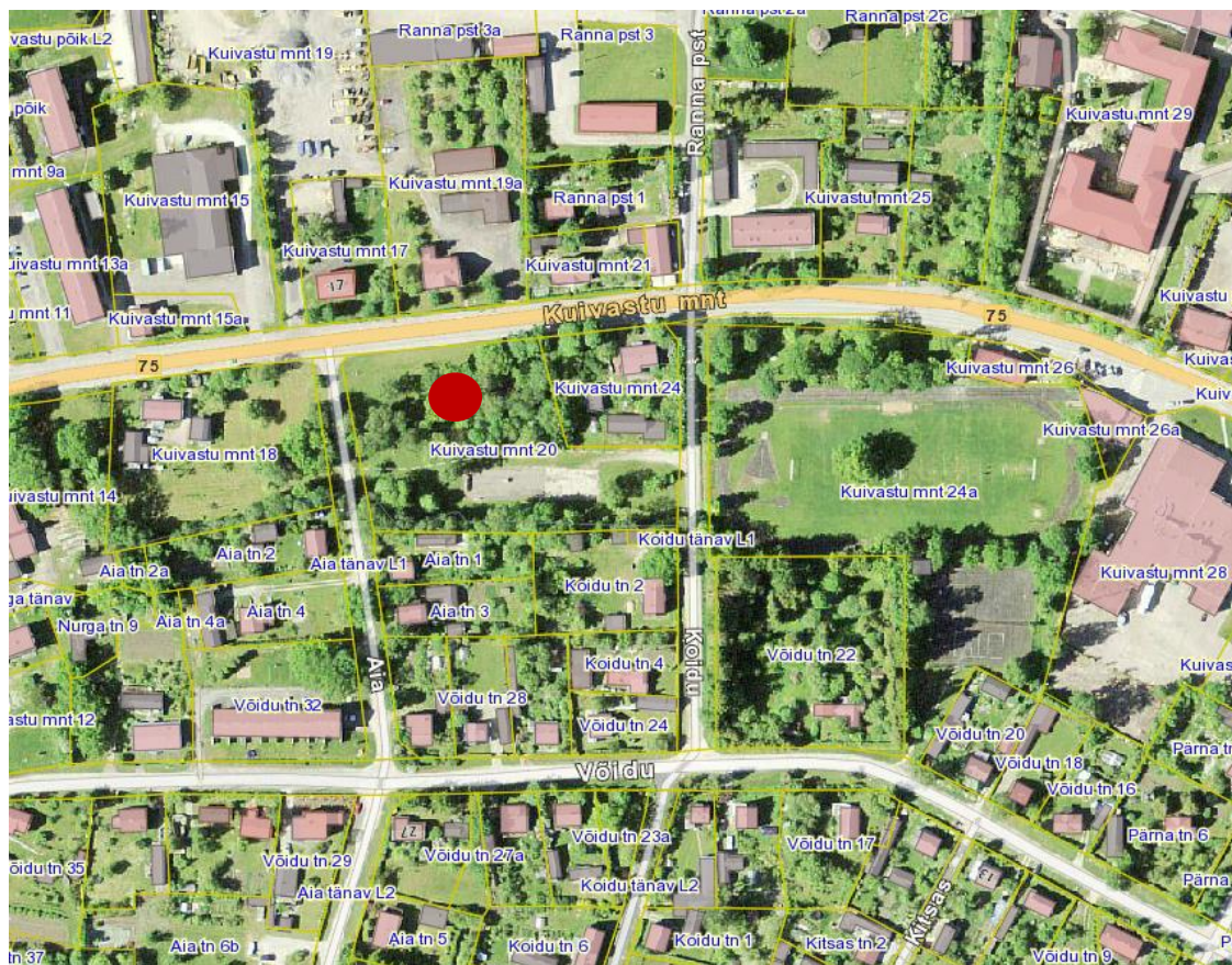
Skeem 1: Planeeringuala asendiskeem