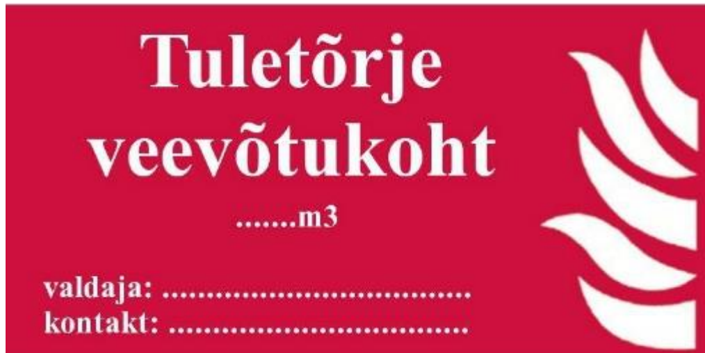
Pilt 3 Mahuti infoviit