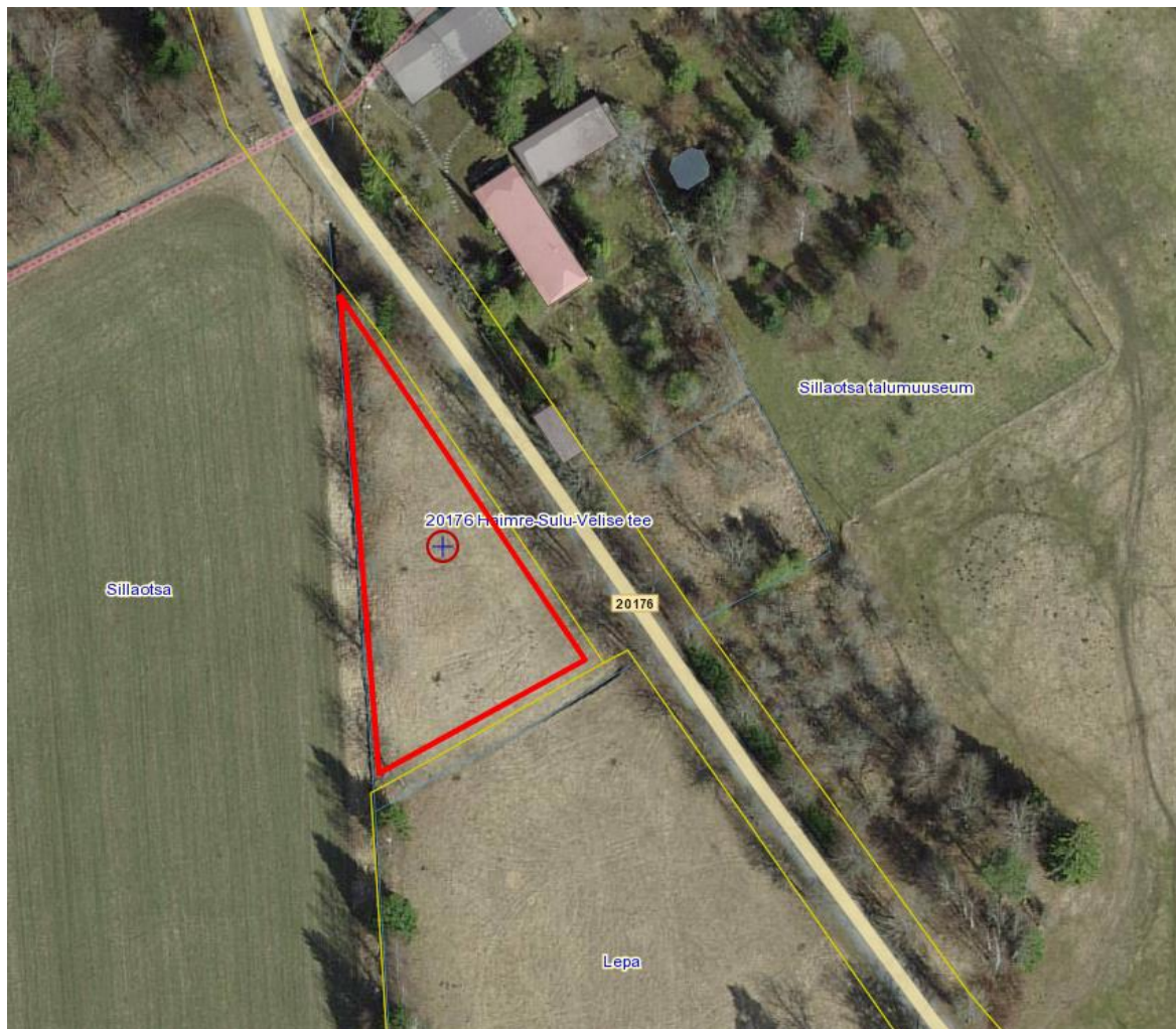
Pilt 1 Asukohaskeem