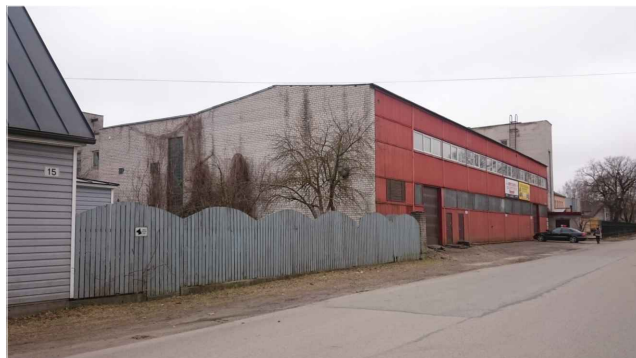
Foto 2. Vaade Suur-Jõe tänavalt