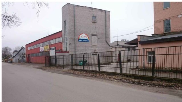
Foto 1. Vaade Suur-Jõe tänavalt.