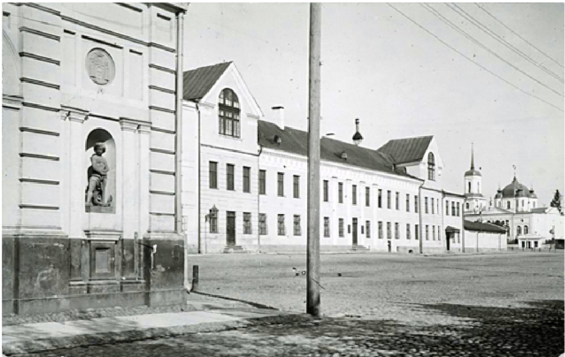
5. Vaade Lihaturule kagust 1929. a.