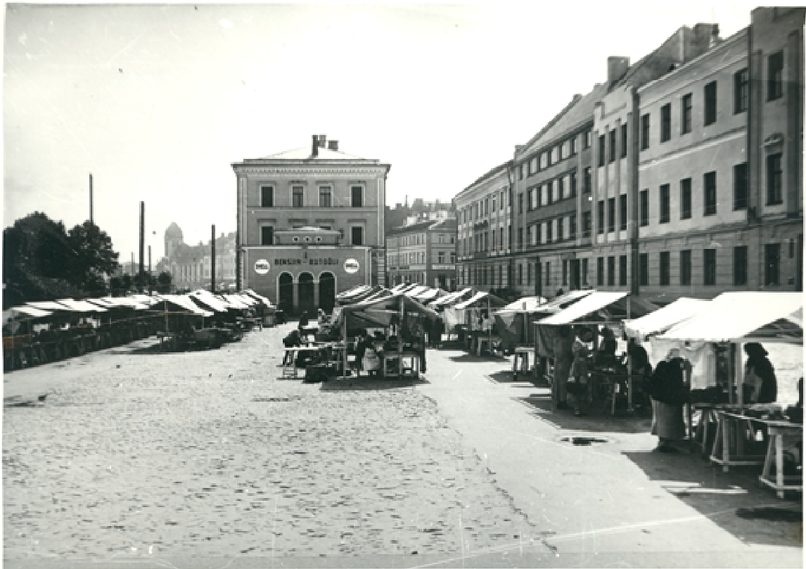
7. Vaade lihaturule põhjast 1937. a.