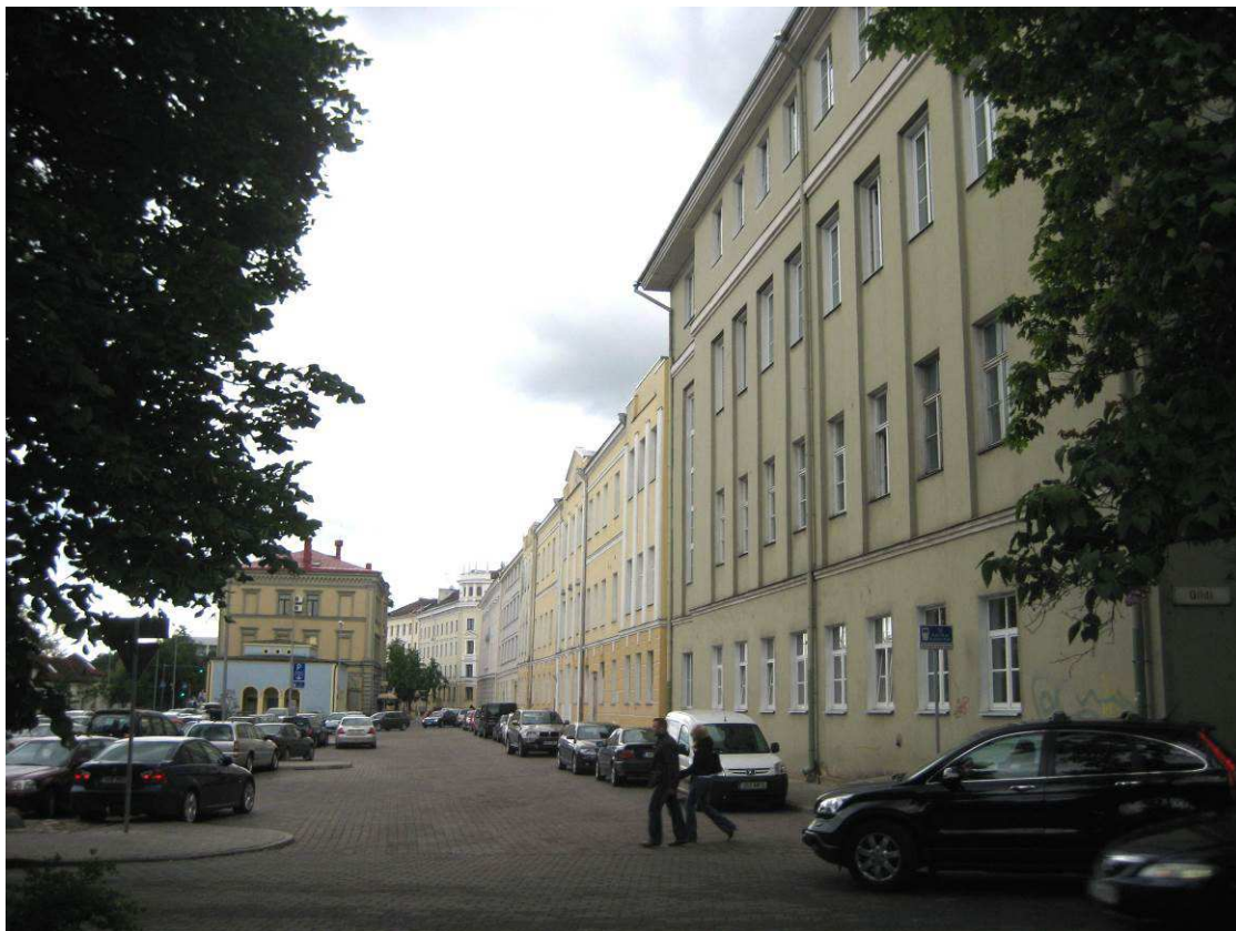
4. Vaade Magistri tänavale Gildi tänava poolt