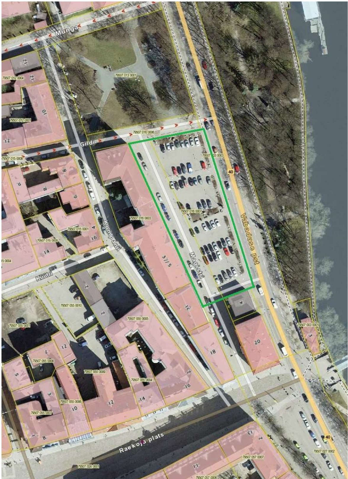
Asendiplaan. Rohelise joonega on markeeritud planeeritav ala. (allikas: Maa-ameti kaardiserver)