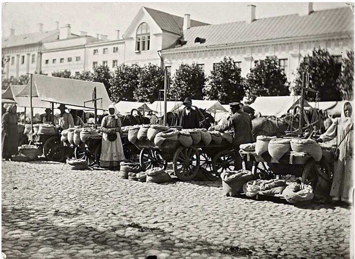
4. Vaade Lihaturule 1912. a.