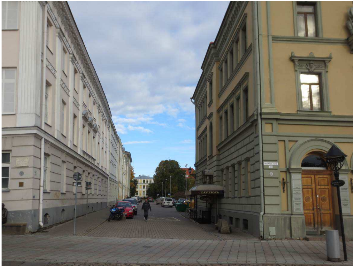
5. Vaade Magistri tänavale Raekoja platsilt