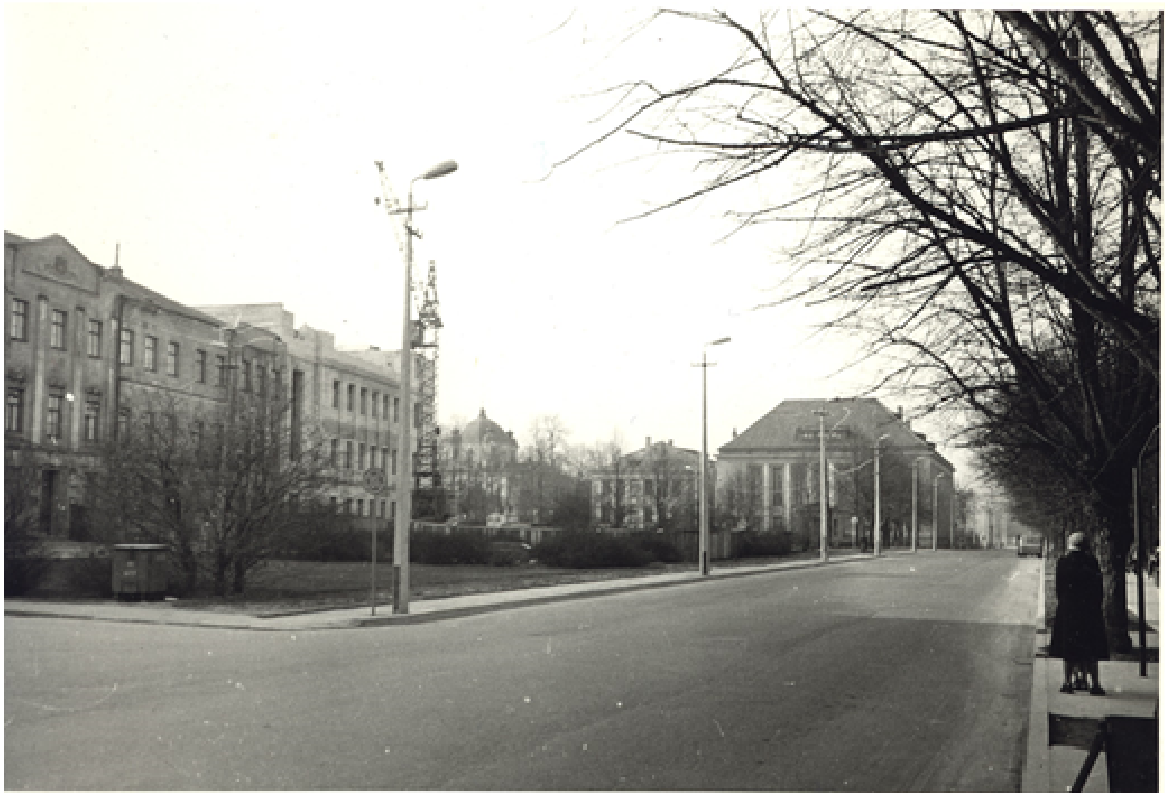
9. Vaade kagust 1978. a.