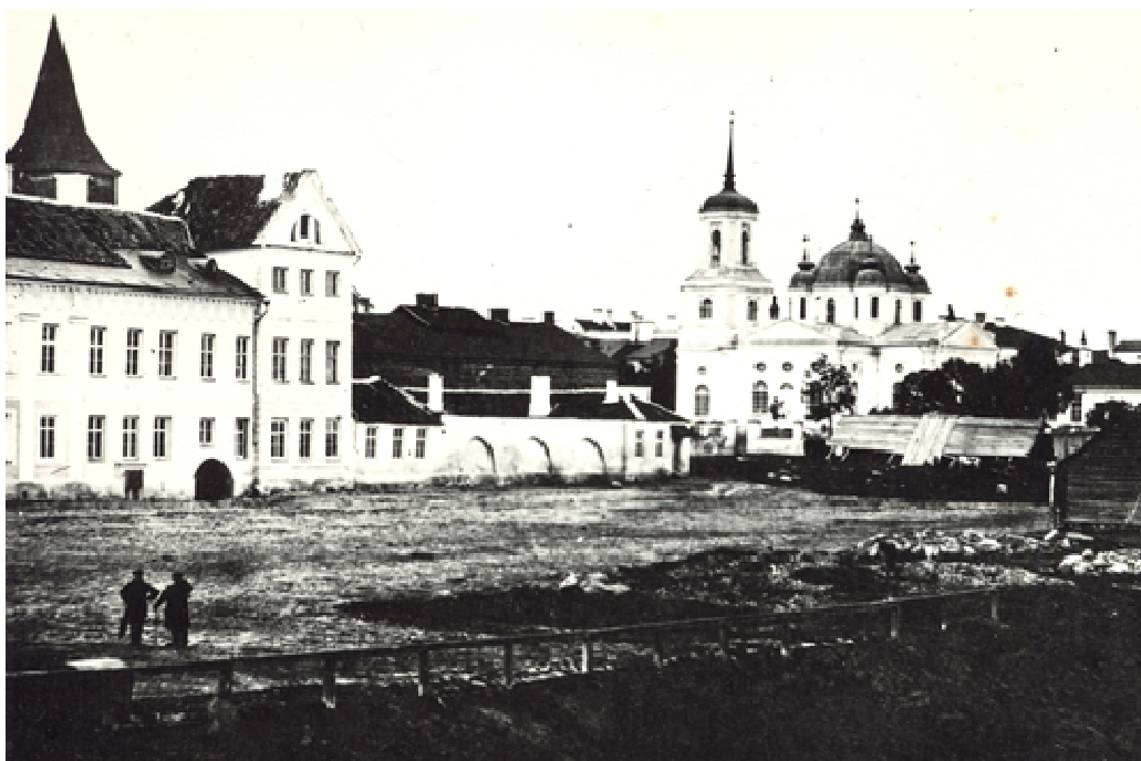
1. Vaade Emajõe äärest, 1865.a.