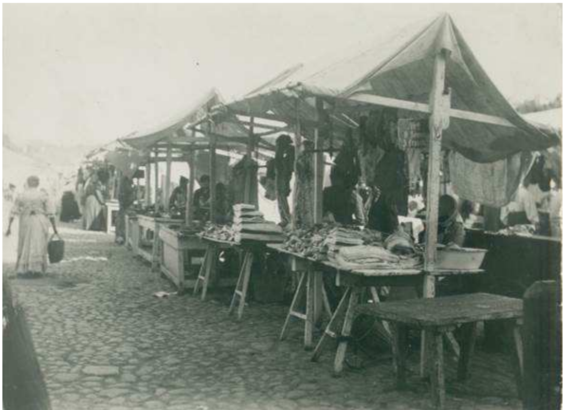
3. Vaade Lihaturule 1912. a. (ERM-i fotokogu Fk 213:277)