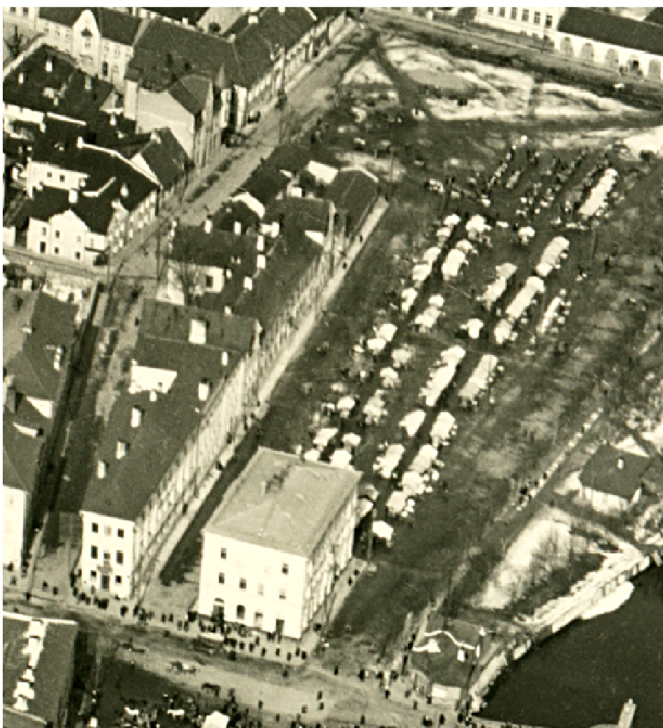
2. Vaade Lihaturule. Fragment aerofotost 20. saj. algusest