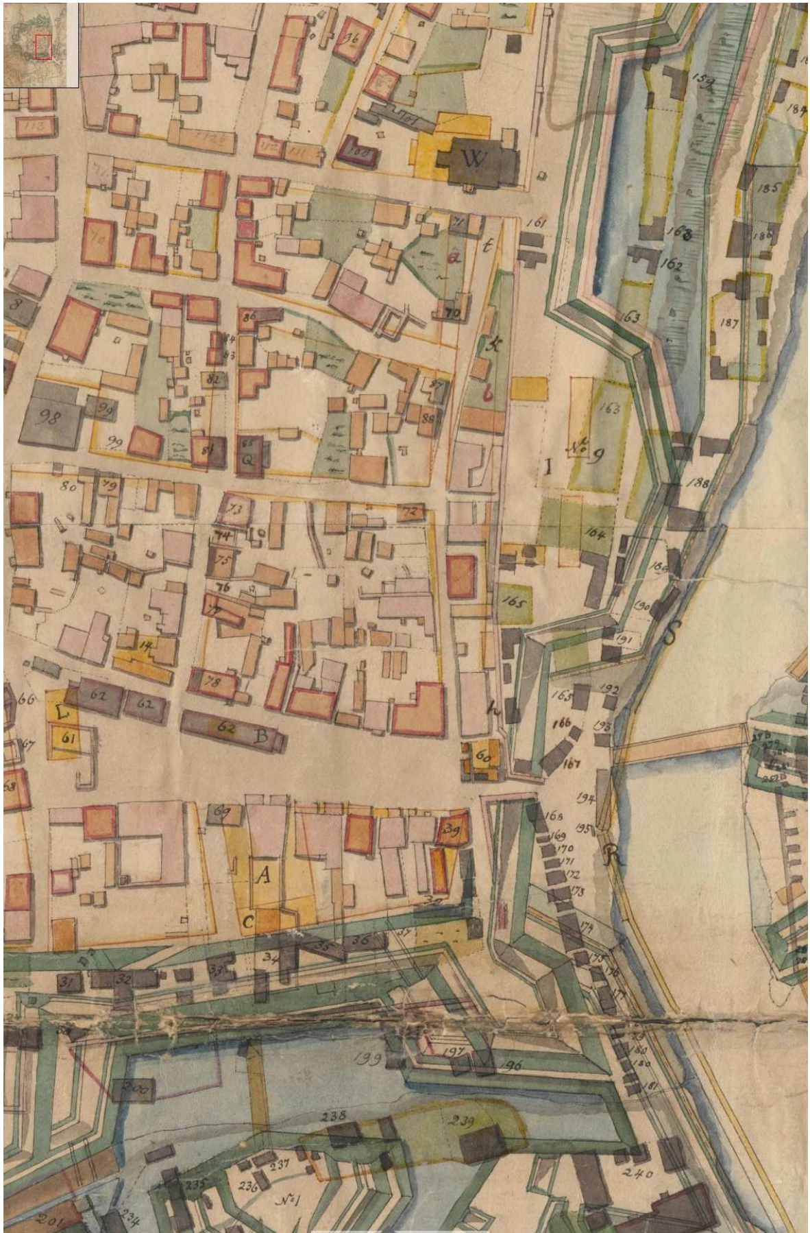
2. Väljavõte Tartu plaanist 1767 a. (EAA.2623.1.2049, l. 49)