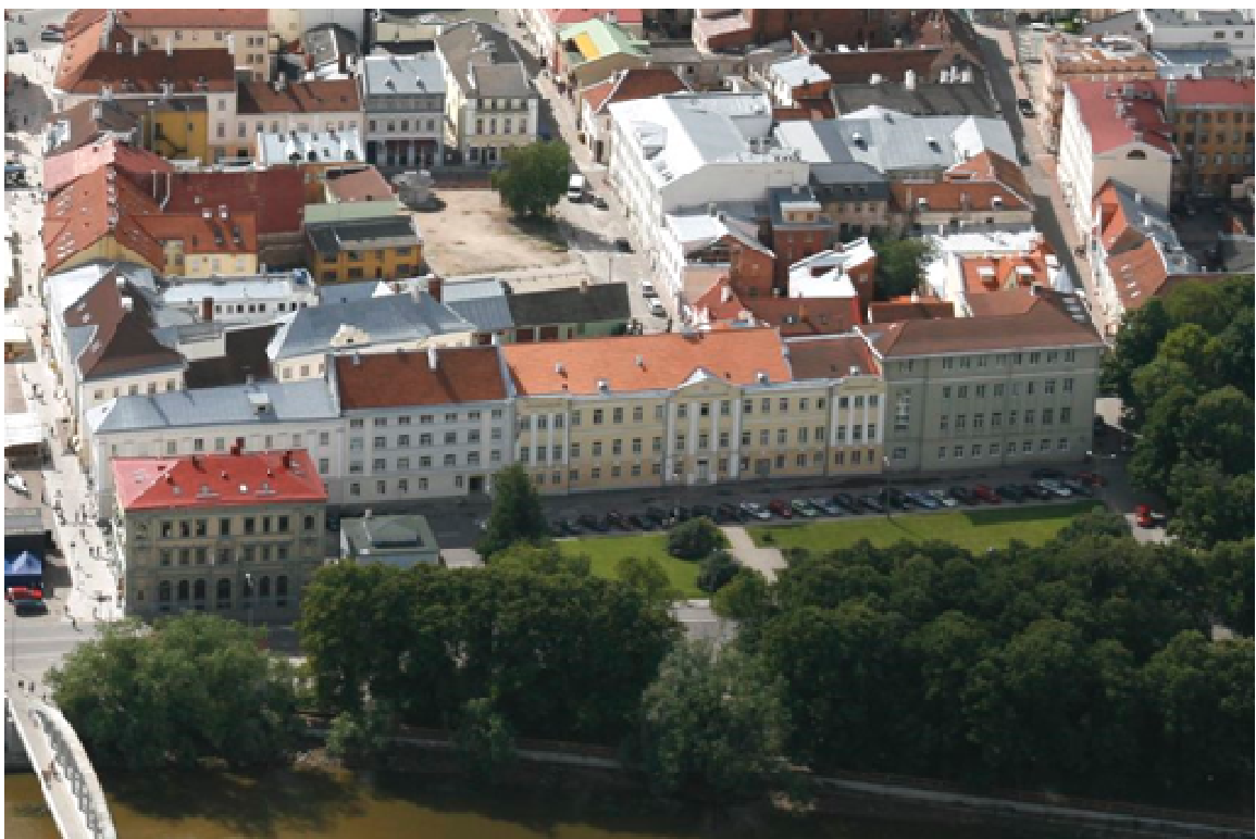
10. Vaade planeeritavale alale enne parkla väljaehitamist 2006.a