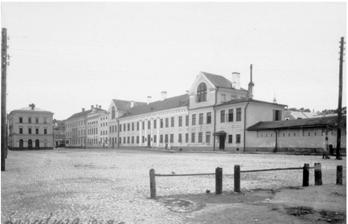
6. Vaade Lihaturule kirdest 1929. a. (ERM-i fotokogu Fk 2821:243)