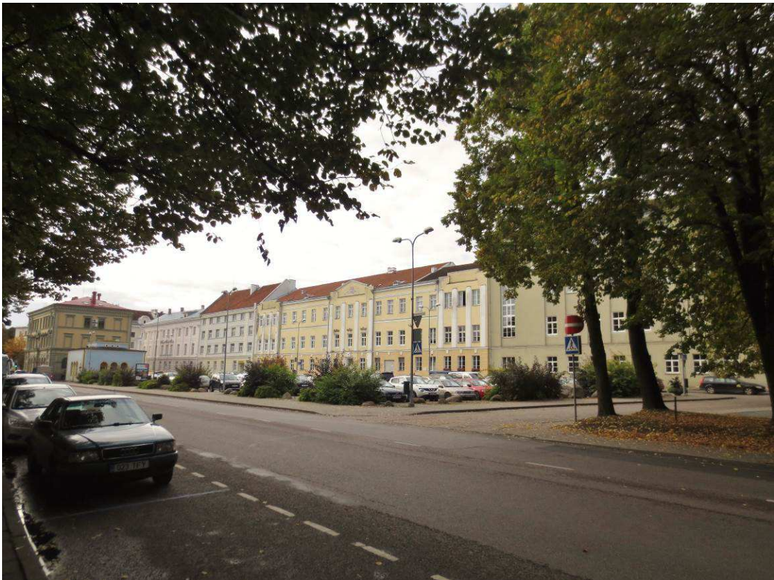
2. Vaade kirdest, Vabaduse puistest