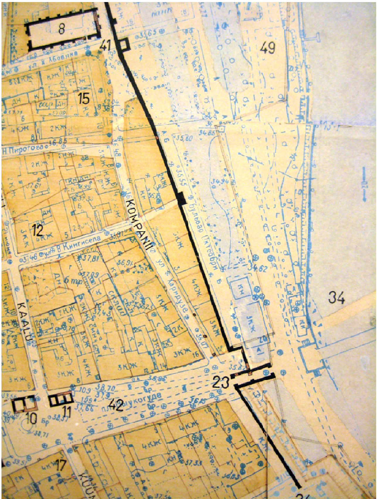
6. Väljavõte Tartu linna plaanist, kus musta joonega on tähistatud keskaegse linnamüüri asukoht tänapäevase hoonestuse suhtes.