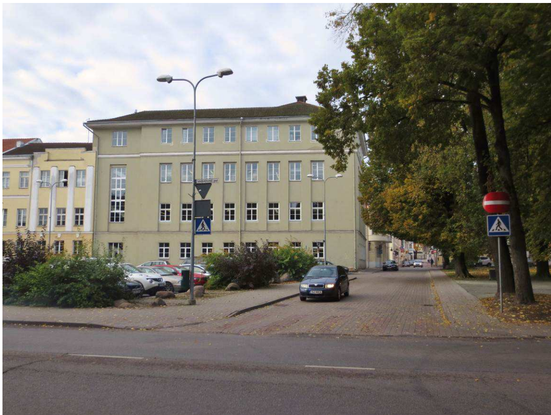
3. Vaade piki Gildi tänavat Vabaduse puiesteelt