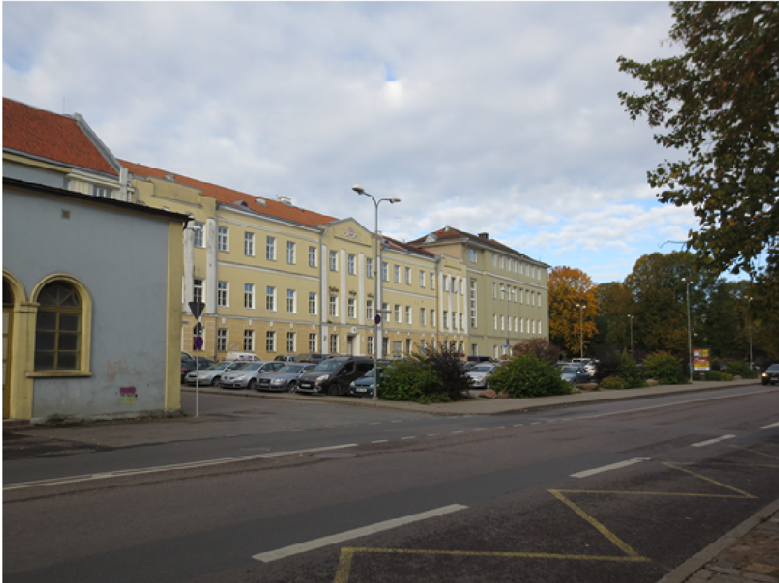
1. Vaade kagust, Vabaduse puistest