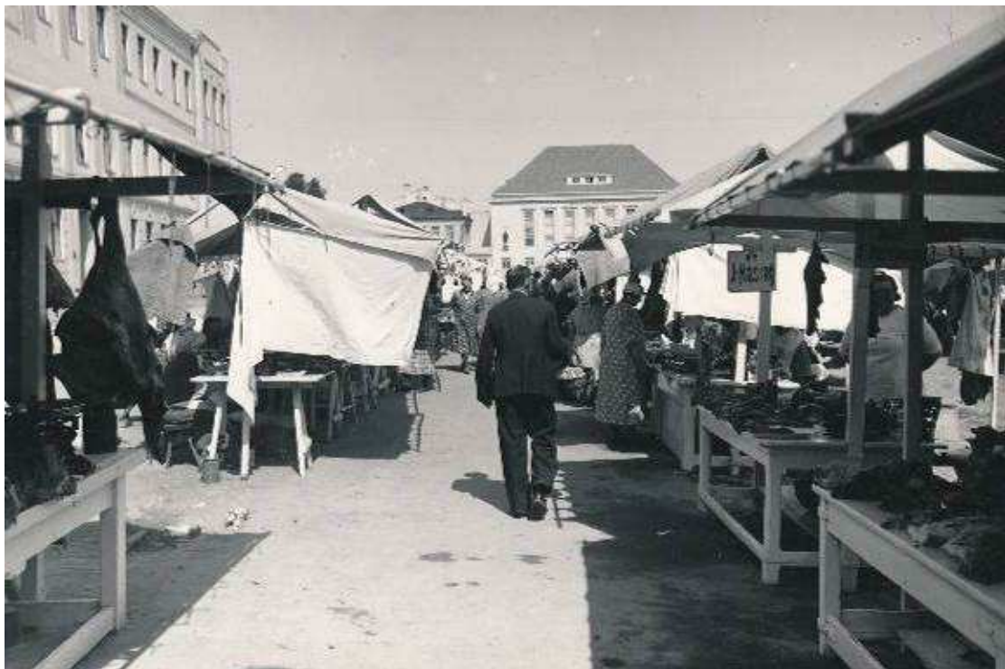
8. Vaade Lihaturule lõunast 1937. a.