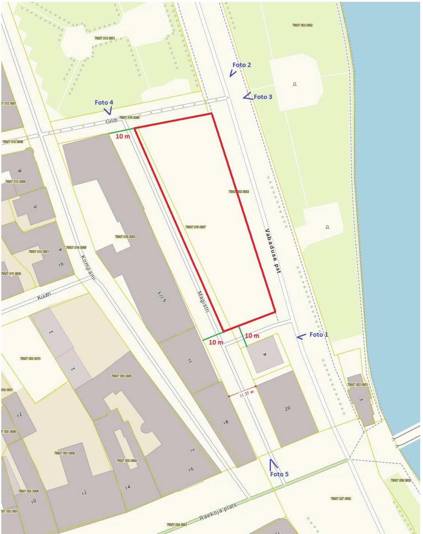
Punase joonega on tähistatud maksimaalne lubatud ehitusaleune pind