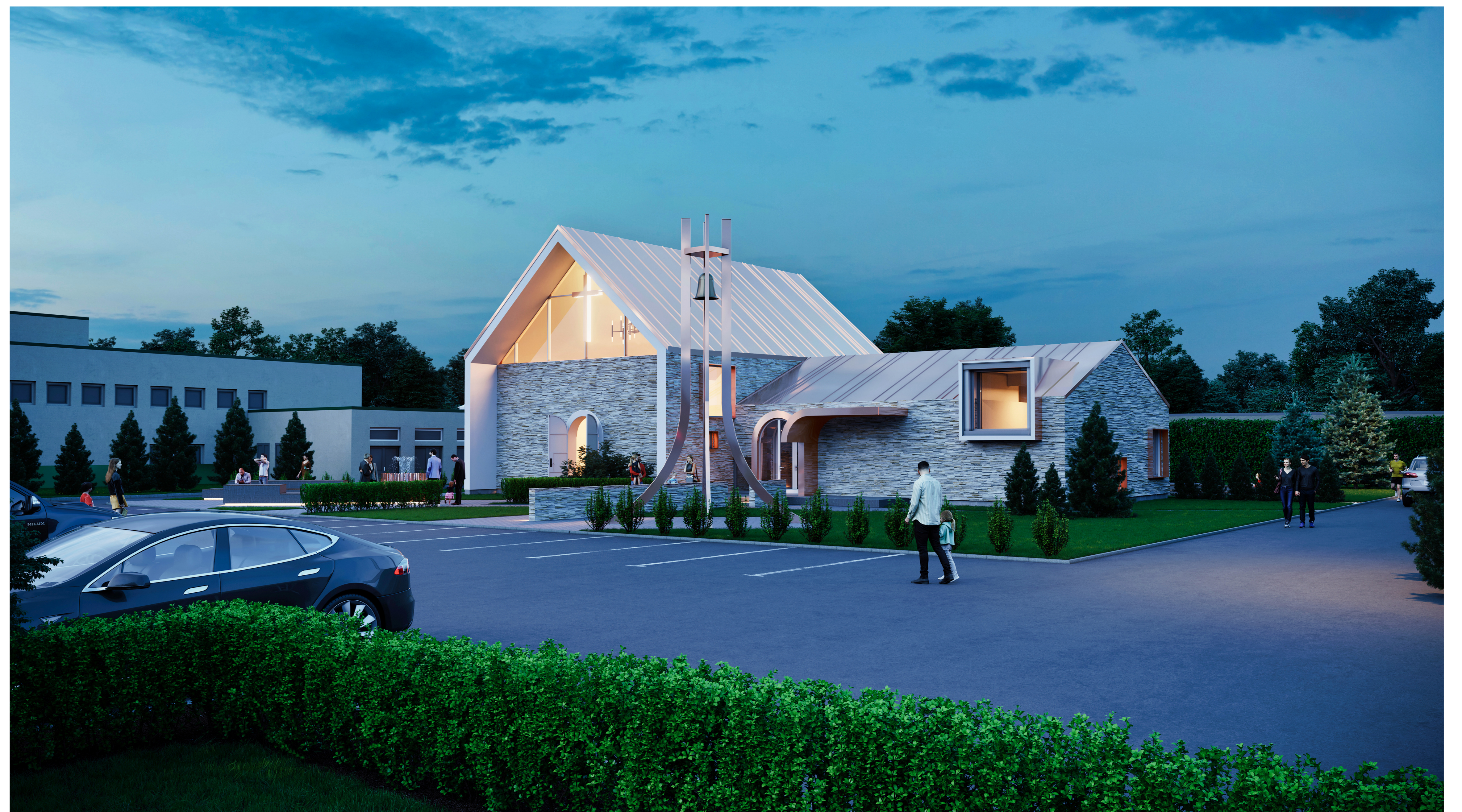
VAADE HOONELE PÕHJAST, õhtune aeg