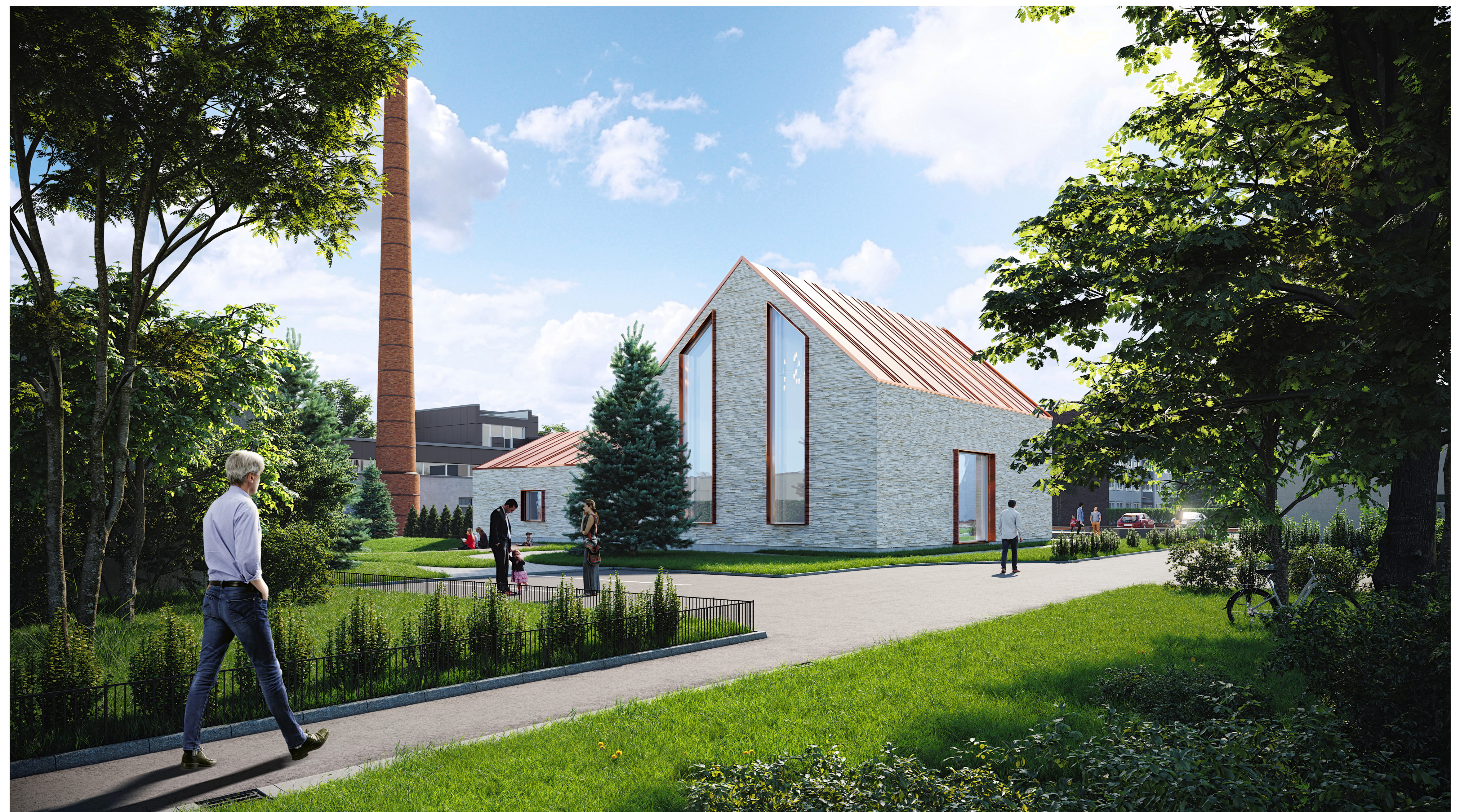
VAADE HOONELE PÕHJAST, päevane aeg