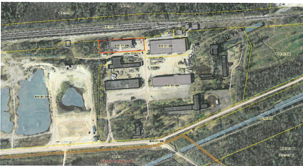
Joonis 1. Detailplaneeringu ala

Detailplaneeringu eesmärk: Materjalide ladu kinnistul soovitatakse laiendada olemasolev hoone rohkem, kui 5% olemasolevast hoone pindalast. Hoone kasutamise eesmärk on laohoone.