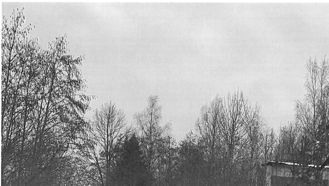
Foto nr 3. Vaade detailplaneeringu alale, hoone, mida soovitakse laiendada, laiendamisele kuuluv maa-ala – sildkraana tugikonstruktsioonid.

Kinnistul asuvad ehitised: hoone – Materjalide ladu nr 7, ehitusalune pind 967m 2 ; Materjalide ladu kinnistu on ümbritsetud tootmismaa, maatulundusmaa ja riigikaitsemaa kinnistutega; Juurdepääs kinnistule toimub Sepikoja kinnistu kaudu.