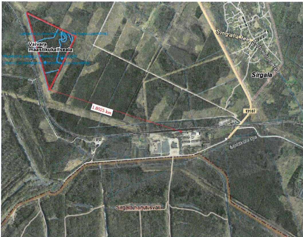
Joonis 3. Looduskaitse- ja Natura 2000 alad

Mõju Natura 2000 võrgustiku alale ja kaitstavatele loodusobjektidele ja –liikidele: Lähedasem kaitseala asub 1,8 km kaugusel detailplaneeringu alast.