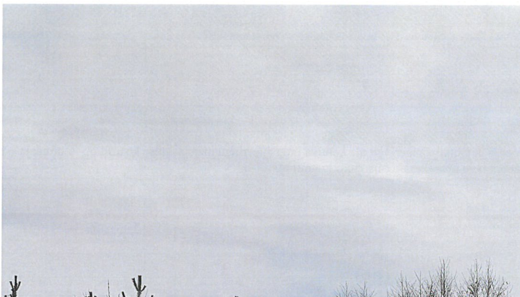
Foto nr 1. Vaade detailplaneeringu alale, hoonele mida soovitatakse laiendada