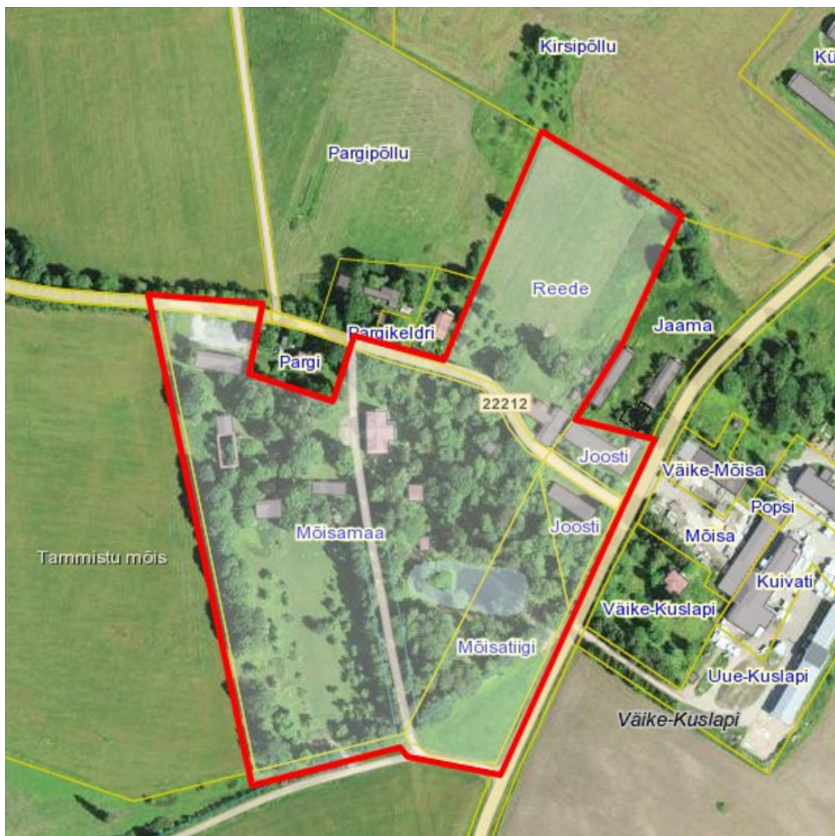
Skeem 1. Planeeringuala piir, väljavõte Maa-ameti kaardirakendusest.

Lisaks hõlmab planeeringuala osaliselt riigimaantee 22212 Väägvere-Tammistu tee (kü tunnus 79403:006:0134, transpordimaa 100%, 0,51 ha; kü tunnus 79403:006:0096, transpordimaa 100%, 0,15 ha; kü tunnus 79403:006:0128, transpordimaa 100%, 0,05 ha) maaüksused.