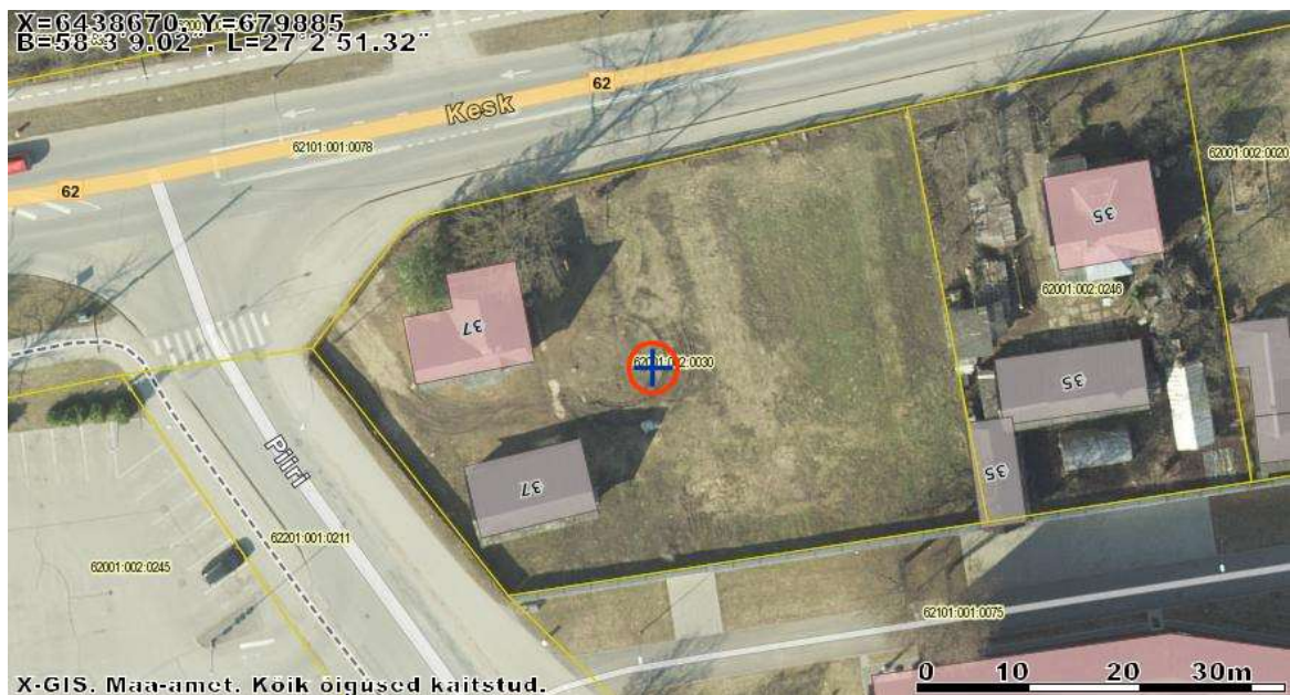
ORTOFOTO KESK TN 37 KATASTRÜKSUSEST