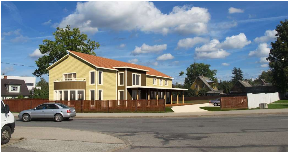
Võimalik vaade Edu keskuse poolt