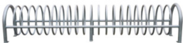
Jalgrattahoidja Mey.

Kinnistule on projekteeritud vastavalt detailplaneeringule 28 parkimiskohta, igale korterile 1 koht. Lisaks on võimalik parkida linna avalikes parklates, mis asuvad 100-200 m raadiuses. Jalgratastele on projekteeritud 20 kohta.