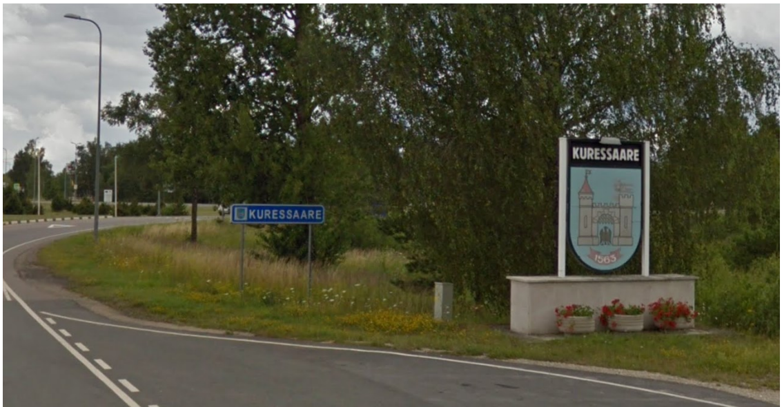
Kujundusala hõlmab Kuivastu poolt saabudes teest paremale poole jäävat Kuressaare linna vappi ümbritsevat ala ja