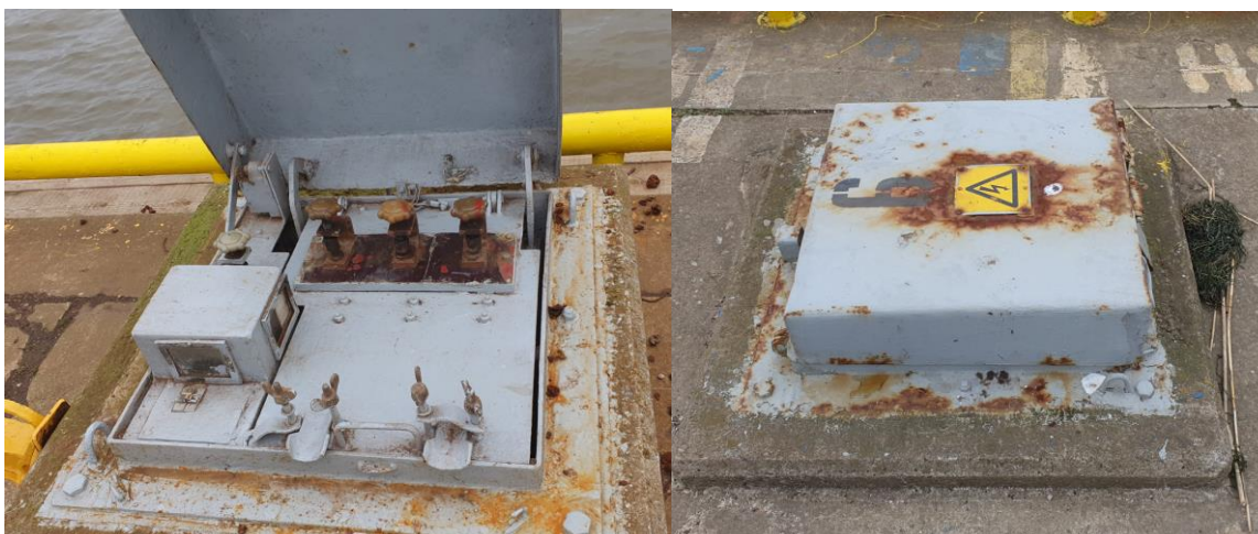
Foto 1. Asendamist vajavad laevakilbid LK1 (kai nr 2) ja LK6 (kai nr 4).