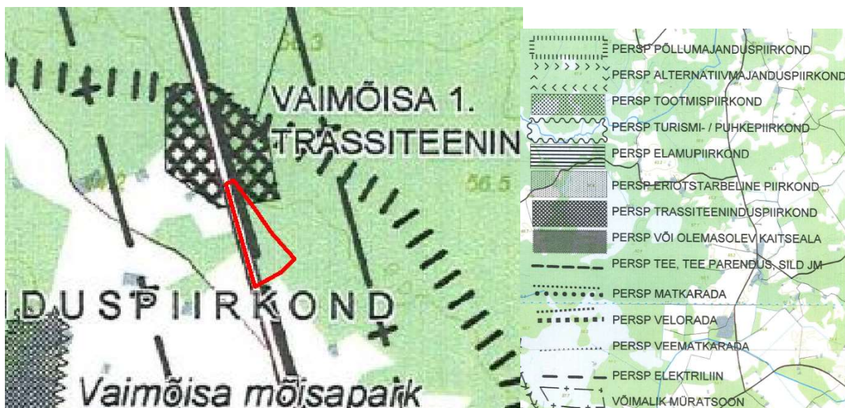
Skeem 1. Väljavõtte üldplaneeringu kaardist. Planeeringuala on tähistatud punase joonega.