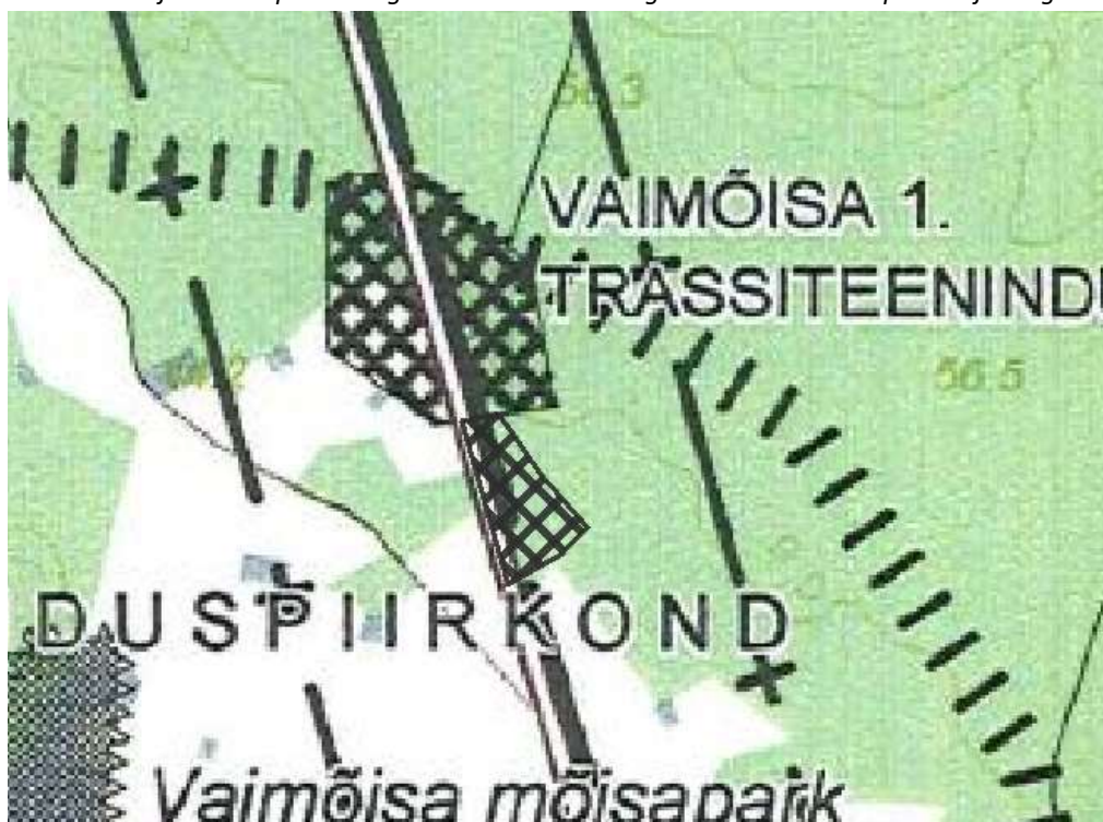
Skeem 2. Üldplaneeringu kaardi muutmise ettepanek.