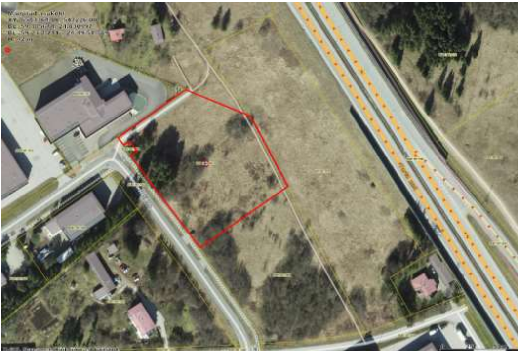
Joonis nr. 1 (asukoha skeem, aluskaart on võetud Maa-ameti geoportaalist http://xgis.maaamet.ee )

Käsitletav kinnistu asub Harju maakonnas, Rae vallas, Peetri alevikus, Reti tee 8 maaüksusel. Maaüksuse sihtotstarbeks on tootmismaa 50% ja ärimaa 50% - pindalaga 8520m 2 . Kinnistu paikneb vahetult Tallinn-Tartu maantee ääres.