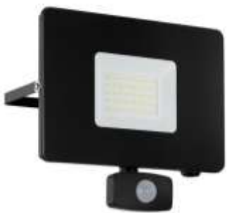
Foto1. Fassaadivalgusti ideeline näide.

Kogu hoone välisvalgustus lahendatakse eraldi projektiga, koos tugevvoolu elektri projektiga.