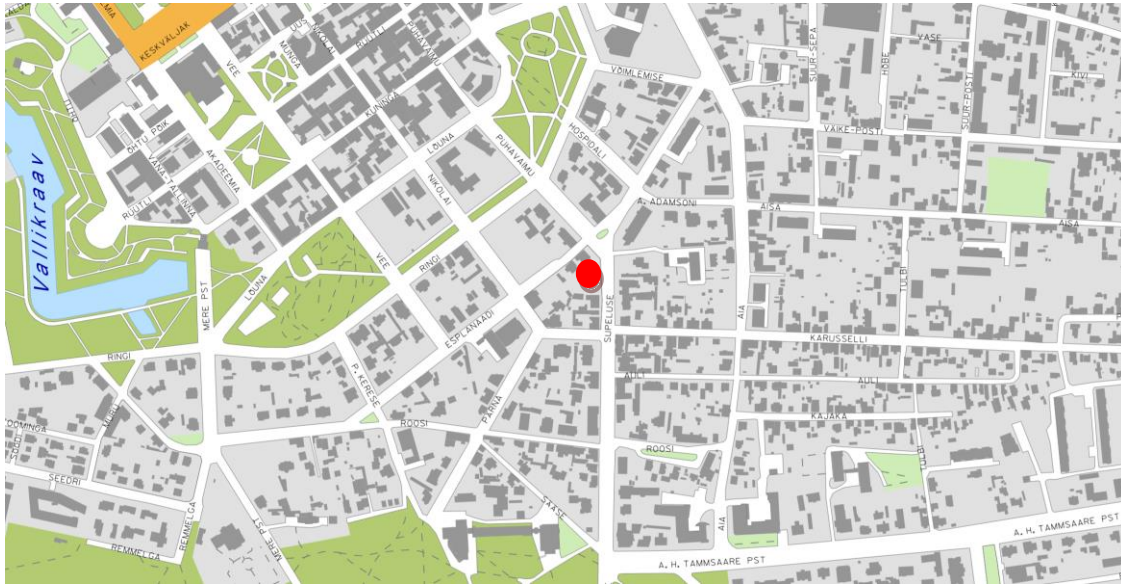
Joonis 1: Planeeringuala asendiskeem

Planeeritav ala aadressiga Suvituse tn 1 (62510:022:3660) asub Pärnu Keslinna linnaosas. Kinnistu on ümbritsetud Esplanaadi tn 8 (62510:022:3620), Supeluse tn 3a (62510:022:9720), Supeluse tn 3 (62510:022:1080), Esplanaadi tänav T2 (62510:022:0002) ning Supeluse tänav T1 (62510:024:0001) katastriüksustega.