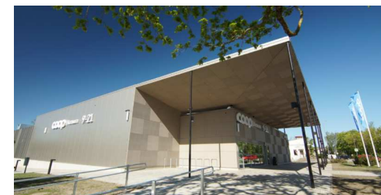
Efektne, ent minimalistlik ning madalama joonega varikatuse joon võrdluseks suursugusele Orissaare Coopile