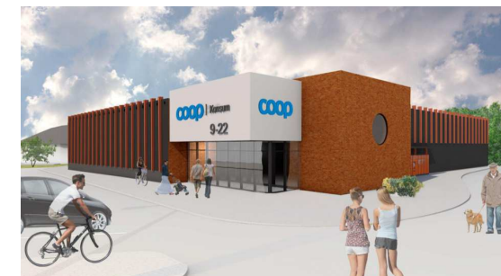
ORANŽI TOONI kasutus analoogselt Loksa ning Lasnamäe Coopile