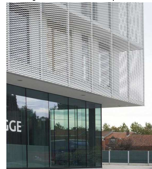
Minimalistliku ja madala joonega KLAASFASSAAD jooks varikatuse all. Klaasfassaad MUSTADE PROFIILIDEGA ning kergelt MUSTAKS TOONITUD KLAASIGA .