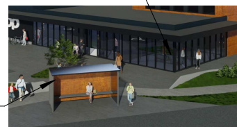
Valget värvi Coop logo (valgustähed), sarnaselt Raadi Coopile alloleval pildil