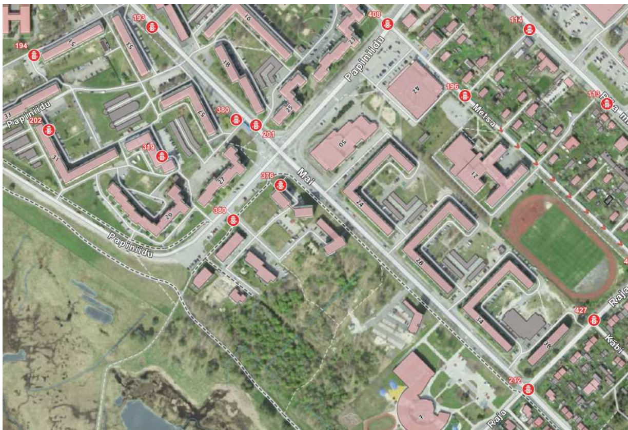
Lähimate hüdrantide asukohad. Väljavõte Maa-ameti kaardilt ohtlikud ettevõtted ja vesivarustus.

Hüdrandi kaugus projekteeritud elamust on ca 200 m.